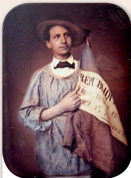
Jeune homme au drapeau, daguerréotype colorié, 1848.

5 mai 1855 : la loi précise et impose le renouvellement des conseils municipaux tous les 5 ans. Les communes de 500 à 1500 habitants sont régies par un maire, un adjoint et 10 conseillers municipaux. Pour être éligible il faut avoir plus de 25 ans.